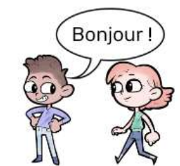
LE GARÇON PARLE

La pointe de l'appendice montre qui parle. Dans l'exemple ci-dessous, l'appendice pointe vers le garçon indiquant que c'est lui qui parle. Si une bulle possède plusieurs queues, cela signifie que plusieurs personnes disent la même chose en même temps.