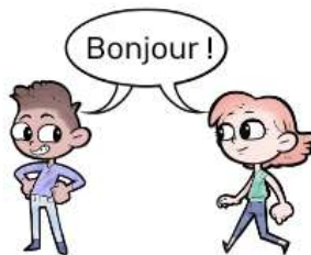
LES DEUX PARLENT