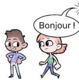
QUELQU'UN D'AUTRE PARLE

Il est important de bien placer la pointe de l'appendice au niveau du visage, ou de la bouche. Si votre bulle montre le ventre, on pourrait croire que votre personnage est ventriloque.