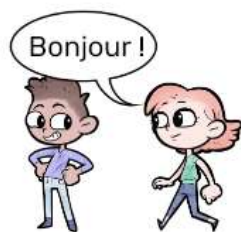
LA FILLE PARLE